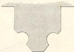
Fig. 243. (Prag.)

Ornamenten-Schmuck, die Fenster und Gesimse waren hier und dort die gleichen. Otakar II. stiftete damals auch eine Kreuzherrn-Commende mit einer Heilig-Geist-Capelle (späterhin S. Bartholomäus-Capelle) in Eger, deren Gewölbe ebenfalls auf einer Mittelsäule ruhten. Da jedoch diese Capelle im Jahre 1414 gründlich erneuert worden ist, haben wir die Beschreibung derselben dem vierten Theile einverleibt, wo die Form des Sterngewölbes angegeben wird.