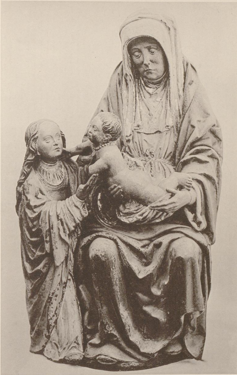
Lichtdruck von Röttger & Jonas, Dresden.