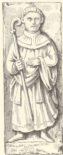
Fig. 290. (Trebič.)

Besser erhalten zeigen sich sechs in der Leibung des darüber befindlichen Hauptfensters eingefügte Reliefs, welche jedoch schwerlich für diese Stelle beantragt waren. Sie stehen je zu drei übereinander, links zu oberst ein Christusbild mit dem Kelch in der Hand, darunter zwei Personen, welche sich die Hände reichen und ganz unten ein Engel. Rechts erblickt man Adler, Stier und Löwen, die Evangelistenzeichen, aus denen