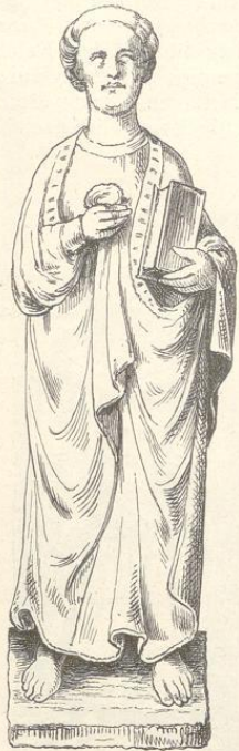
Fig. 291. (Schüttenitz.)

Fig. 292 Reliefs an der rechten Seite des Hauptfensters, Fig. 293 Reliefs an der linken Seite, Fig. 294 der Tempelstein.