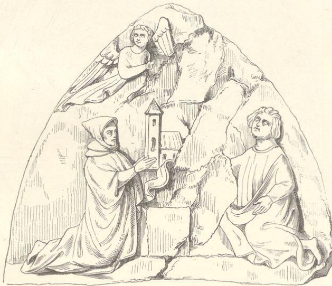
Fig. 295. (Klingenberg.)

Das Bild ist umgeben mit einem doppelten Kranze von Eichen- und Schilfblättern, welcher in den Hohlkehlen hinzieht. Das anspruchlose ungemein graziös durchgebildete Relief ist aus hartem ziemlich grobkörnigen Granit gemeißelt, offenbar von einem Klosterbruder, der wohl mehrere Jahre der Vollendung zugewandt hat. Auch die Capitäle, welche den zwischen den Kehlen durchlaufenden Rundstab tragen, wie die leichten durch den Weinstock geflochtenen Ranken sind mit demselben feinen Geschmack und derselben Liebe ausgeführt.