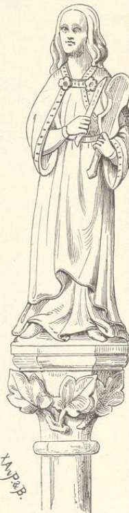
Fig. 298. (Kolin.)

Andere meist sehr rohe Bruchstücke von Bildwerken finden sich in vielen alten Kirchen, so in Schlan, Rakonie, Altbunzlau, Nimburg und Budweis; sie gewähren über die künstlerische Entwicklung des Jahrhunderts keine Aufschlüsse, wesshalb Abbildungen sich als unwesentlich darstellen.