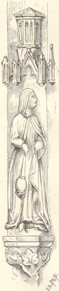
Fig. 297. (Kolin.)

theils gottesdienstliche Handlungen verrichtend aufgestellt. Zwei dieser Engel, von denen der eine die Geige spielt, der andere das Rauchfass schwingt, wurden in die Reihe der Abbildungen aufgenommen.