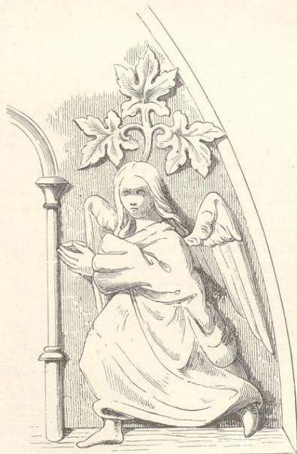
Fig. 300. (Kolin.)

und sinnreiche Sprüche auszeichnen. Es kommen im Ganzen sieben oder acht verschiedene Muster vor, darunter die Landeswappen, Adler und Löwe, ferner Drachenbilder, Früchte und Arabesken. Die Abdrücke sind an den wenig betretenen Stellen noch