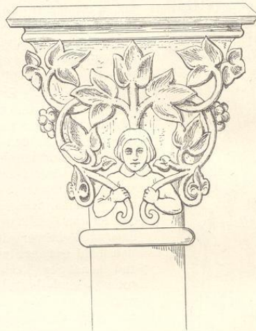
Fig. 301. (Kolin.)

In dem nahe bei Klingenberg gelegenen Schlosse Vorlik, auch in Strakonice wurden vor einigen Jahren verschiedene Terracotten, von mitunter vorzüglicher Arbeit, gefunden. Der Fabricationsort dieser Thonwaren ist nicht bekannt, dürfte aber in der Nähe zu suchen sein, da in der Gegend von Budiweis vorzüglicher Thon gestochen wird.