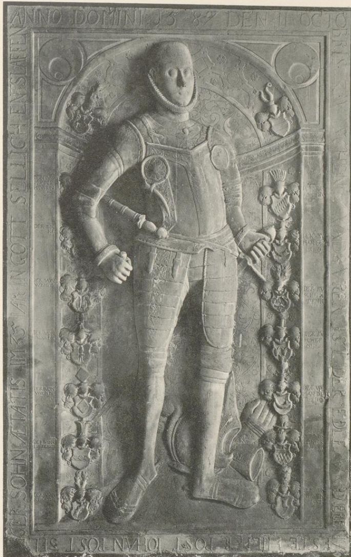
Druck von Georg Alpers jun., Hannover.