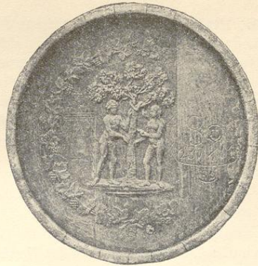
Weinfaß in Niederkaufungen.