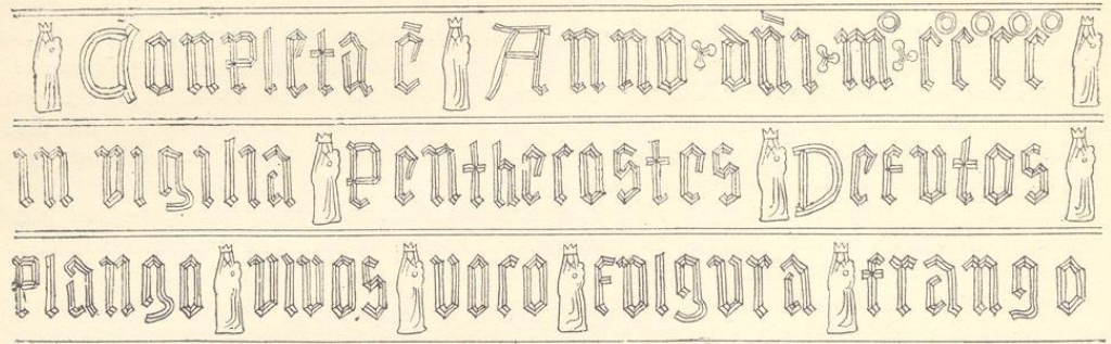
Tafel 54, 3—2

In der Schriftreihe als Trennungszeichen zwischen den Zahlen Punktdreiecke, zwischen den Wörtern Maria mit Kind, 0,012 m breit und 0,04 m hoch. Auf Ost-, Süd-, West- und Nordseite Flanke bärtiger Mann in kurzem Gewande mit Schwert oder Zepter auf Konsole, 0,03 m breit und 0,09 m hoch. Am Unterteil Klöppel eingehauen