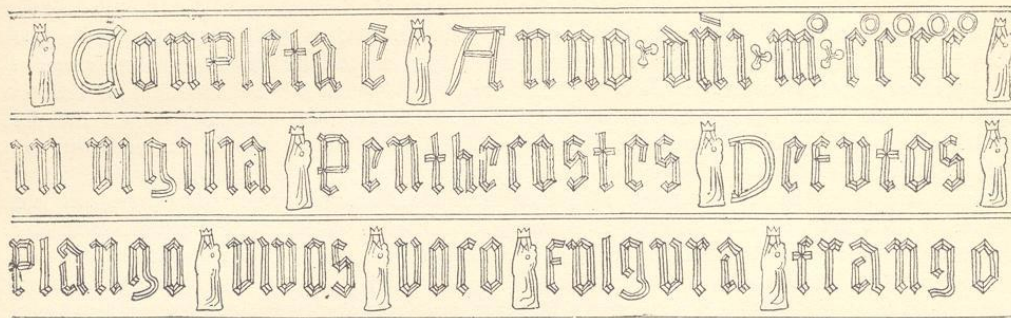
Tafel 54, 3-5 In der Schriftreihe als Trennungszeichen zwischen den Zahlen Punktdreiecke, zwischen den Wörtern Maria mit Kind, 0,012 m breit und 0,04 m hoch. Auf Ost-, Süd-, West- und Nordseite Flanke bärtiger Mann in kurzem Gewande mit Schwert oder Zepter auf Konsole, 0,03 m breit und 0,09 m hoch. Am Unterteil Klöppel eingehauen