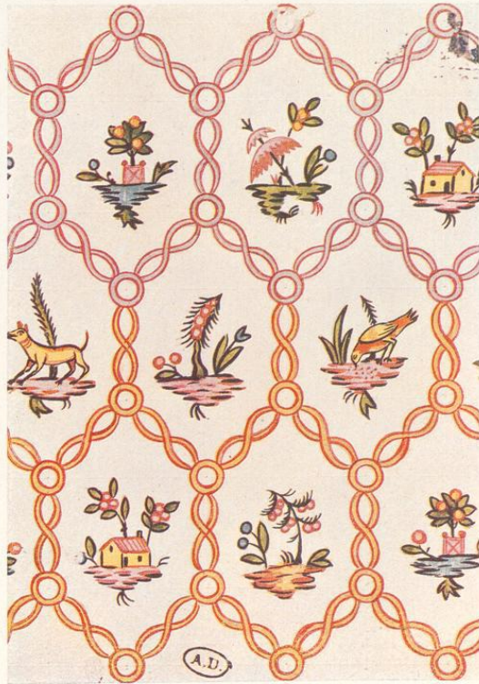
Dekorative Vorbilder, XXVII, III