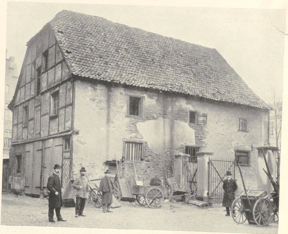
Abb. 582. Der Ratsstall von Südwesten