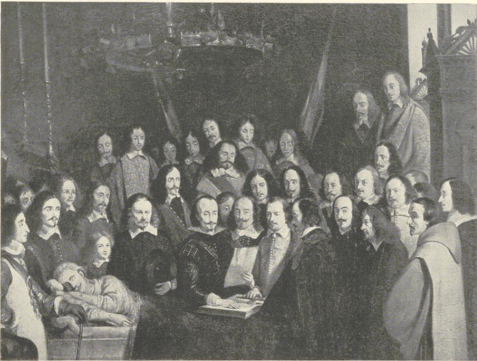
Abb. 570. Gerhard Ter Borch: Die Leichenfeier (Ausschnitt; S. 399)