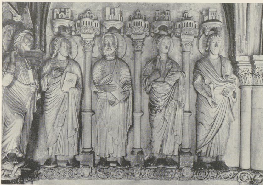
Abb. 1390. Skulpturenschmuck des Paradieses: westliche Hälfte der Nordwand Vgl. S. 62