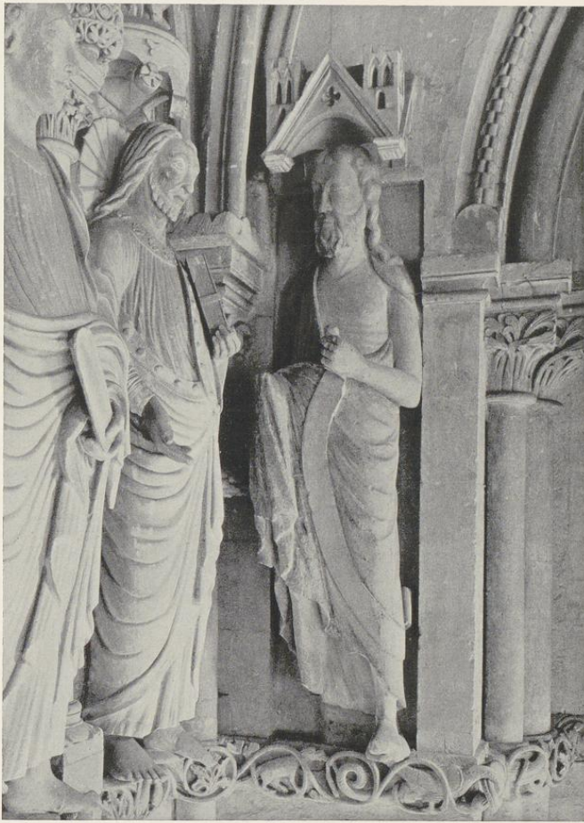
Abb. 1391. Skulpturenschmuck des Paradieses: