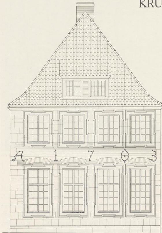
Abb. 935. Aufriß des Hauses Krummer Timpen 16; Maßstab 1 : 100

ERLÄUTERUNG. Zweigeschossiges, vierachsiges Backsteinhaus mit Walmdach. Der Eingang liegt in dem nördlichen