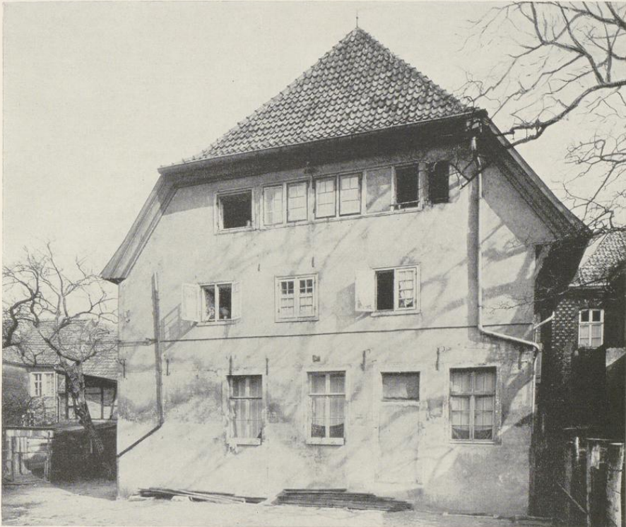
Abb. 933. Rückfront des Hauses Lütke Gasse 6