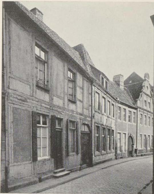
Abb. 936. Die Häuser Krummer Timpen 15, 16 und 17/19 Aufnahme 1935

An der verputzten südlichen Längswand des Hauses haben sich Reste eines gotischen Wasserschlages und Spuren eines Fensters mit Pfosten und Brücke von einem älteren Gebäude erhalten.