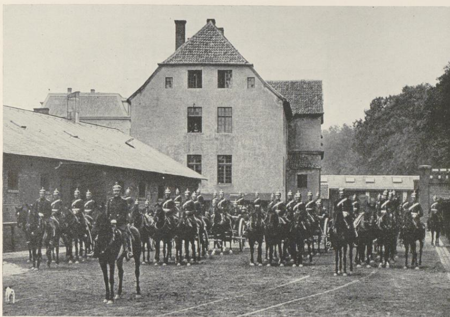
Abb. 957. Das Fürstbischöfliche Münzhaus von Osnabrück