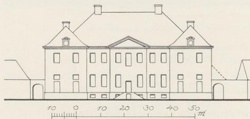
Abb. 974. Aufriß eines Adelshofes auf dem Bocksplatz Bauzeichnung Nr. 669, Pause