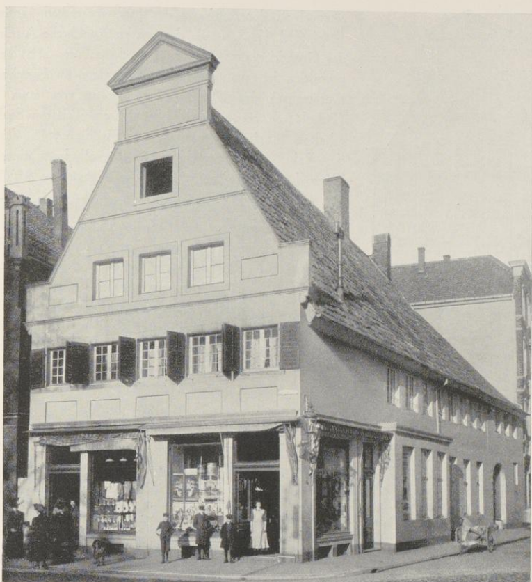
Aufnahme der Sammlung Hötte um 1900