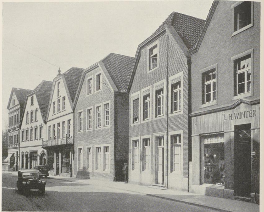
Abb. 1027. Die Häuser Ägidistraße 47—51 von Nordosten Das hier besprochene Haus Ägidistraße 49 ist das vierte von links