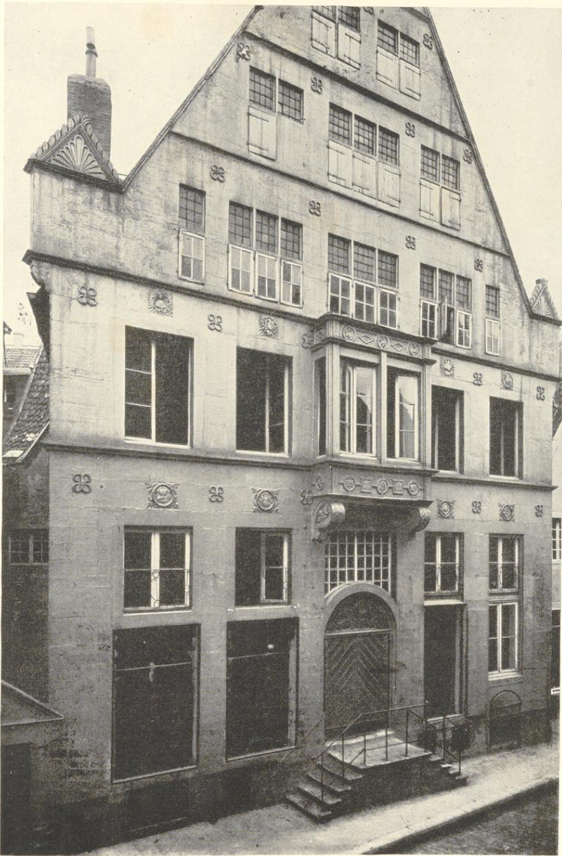
Abb. 802. Front des Hauses Rothenburg 2