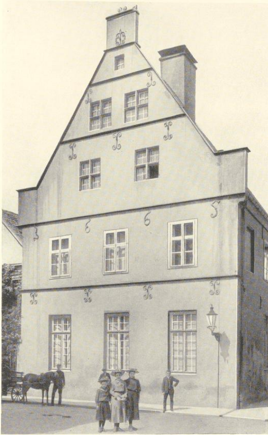
Aufnahme um 1910