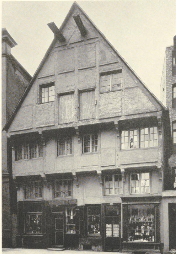
Abb. 893. Das Haus Salzstraße 59/60