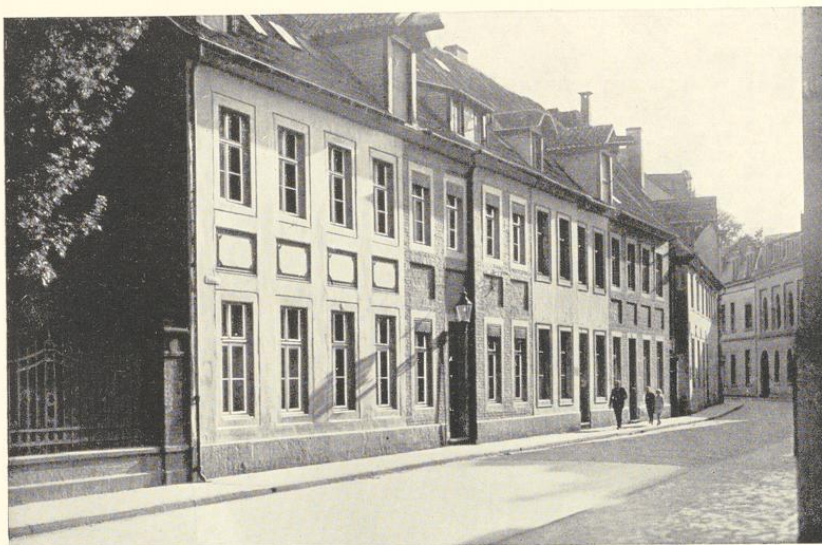
Abb. 905. Die Häuser Bispinghof 5—9 von Nordosten