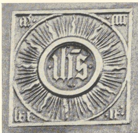
Abb. 631. Holztafel mit dem Monogramm Christi und der Jahreszahl 1479

ERLÄUTERUNG. Es fällt bei der auf Wunsch meines Vaters hergestellten Zeichnung auf, daß bei der kleineren Front sowohl die Fenster der beiden unteren Geschosse wie jene des Giebels aus der Mittelachse gerückt sind. Wahrscheinlich liegt ein Versehen des Zeichners vor. Am Haupthause zwischen den Mittelfenstern des Obergeschosses ist ein Zierstein ange- deutet, von dem eine Skizze meines Vaters vorliegt: in einem oben rundbogig abgeschlossenen Rahmen oben das von Strahlen umgebene Monogramm ih̄s , unten in einem schmalen Rand- streifen die Jahreszahl mccccxxix . Die Zeichnung von 1870 zeigt, daß damals mit Ausnahme des untersten sämtliche Wasserschläge beider Fronten, die Backsteinfialen an den Staffelecken und die Fensterkreuze aller Fenster bereits entfernt waren. Das erst vor kurzem verputzte Haus Ludgerstraße 76 zeigt übrigens, wie die Einzelheiten in der Wiedergabe der oberen Staffel- abschlüsse zu verstehen sind und in welcher Weise der Doppelgiebel zu rekonstruieren wäre. In der obersten Staffel des Hauptgiebels ist anscheinend das Fensterchen fortgefallen. Das der Zeichnung von 1910 zugrunde liegende, stark von der Seite gesehene, leider nicht erhaltene Lichtbild gibt, abgesehen von dem Schaufenster unten rechts, den gleichen Zustand des Doppel- hauses wieder.