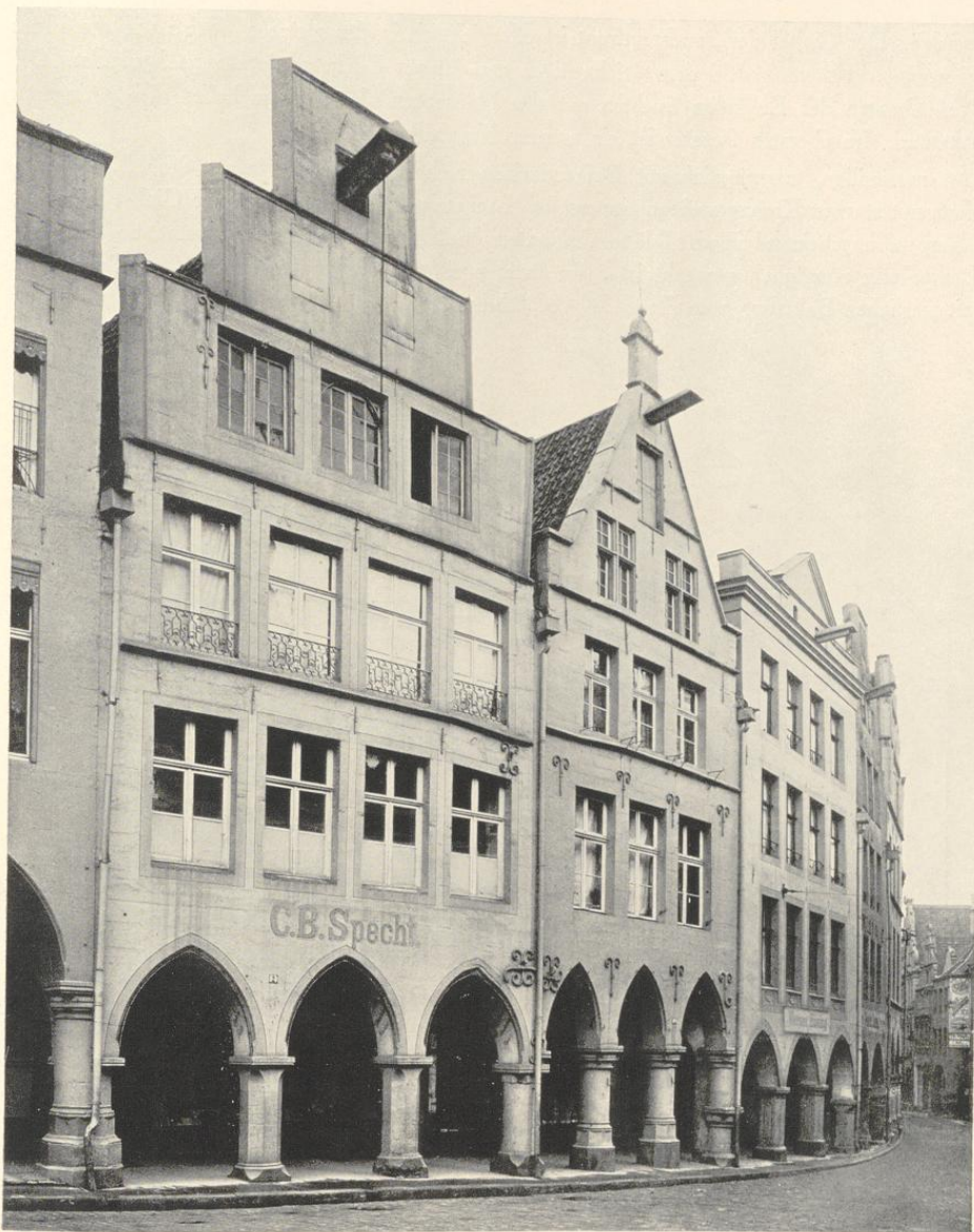
Abb. 635. Die Fronten der Häuser Roggenmarkt 2 und 3 Das erste Haus von links ist das hier besprochene