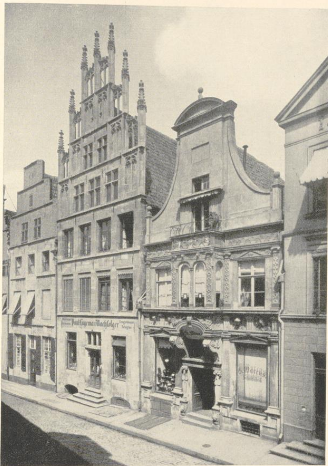
Abb. 640. Die Häuser Roggenmarkt 10, 11 und 12 Das zweite Haus von links ist das hier besprochene