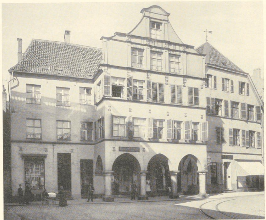
Abb. 645. Die Häuser Rothenburg 44 und 45. Das letztere, rechts vom Bogenhause ist das hier besprochene