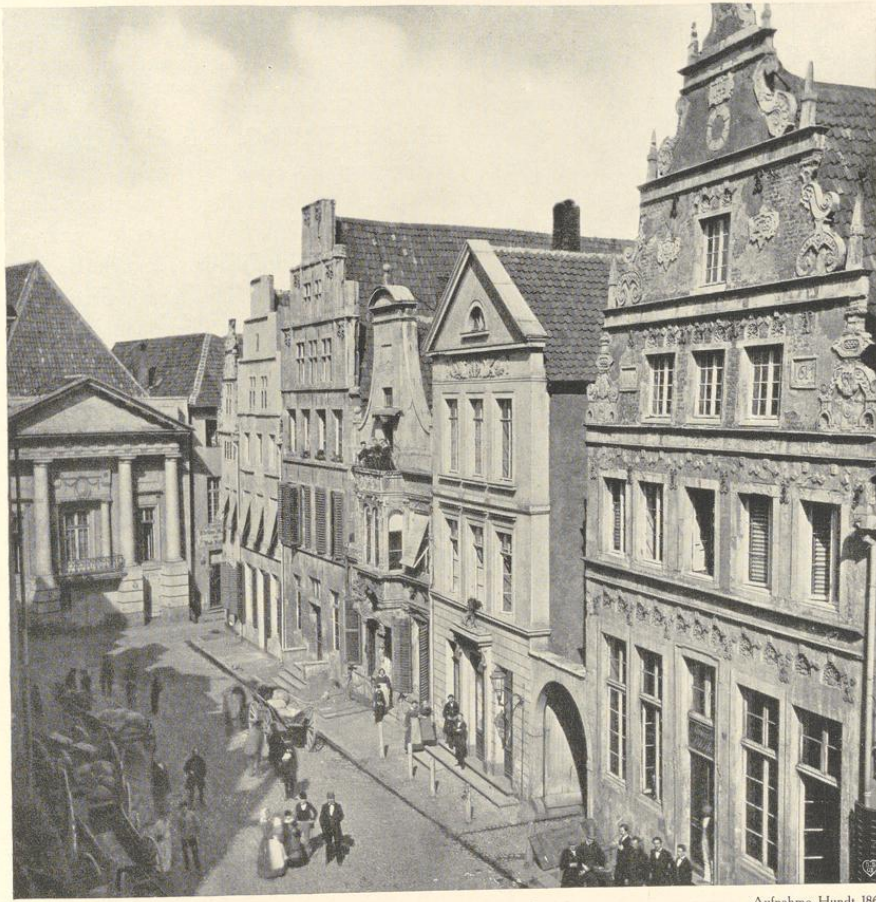
Abb. 681. Ansicht des Roggenmarktes von Süden, Nr. 9—14