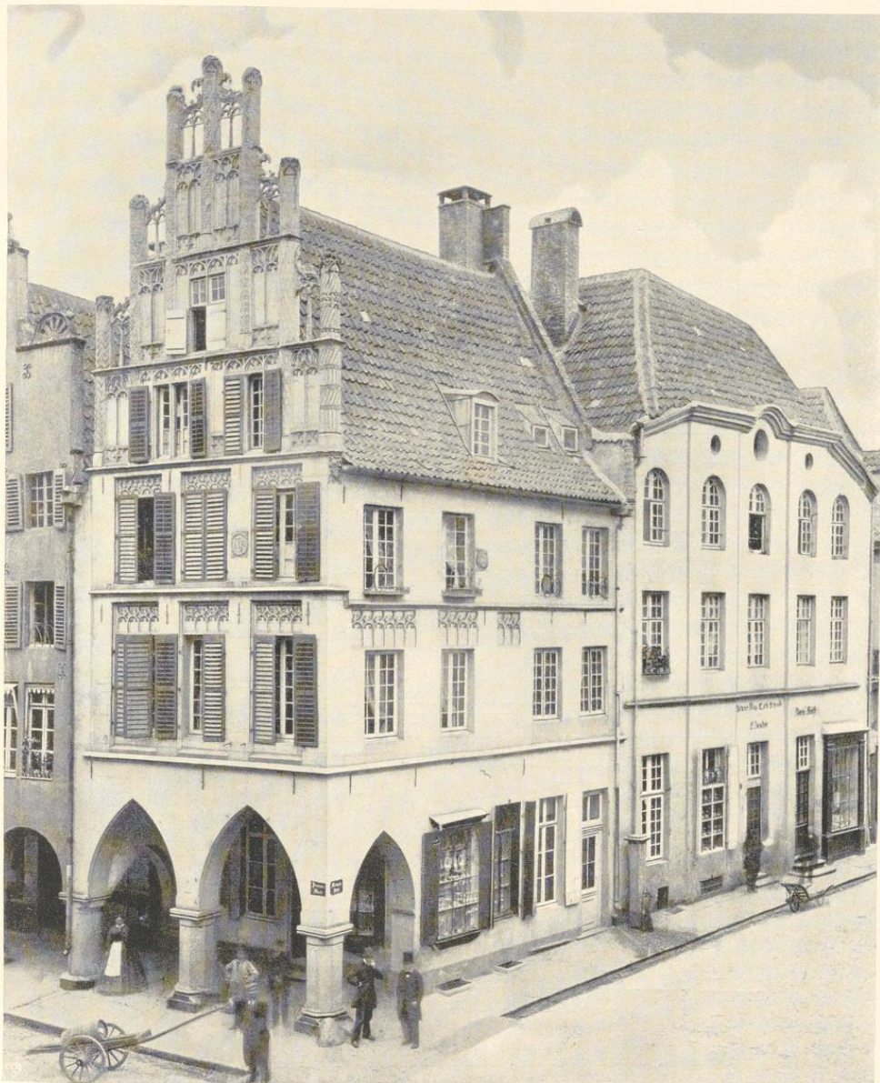
Aufnahme F. Hundt 1864