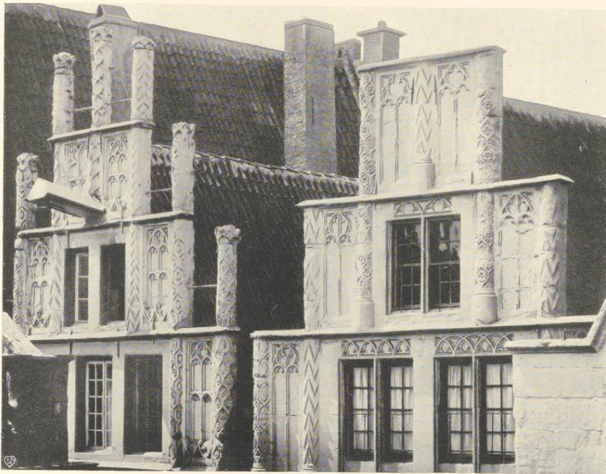
Abb. 702. Die Giebel der Häuser Drubbel 4 und 5/6