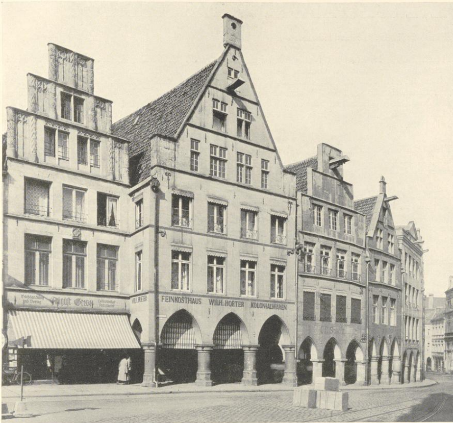
Abb. 706. Die Häuser Drubbel 5/6 und Roggenmarkt 1—4