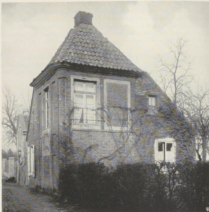
Aufnahme der Sammlung Hötte um 1900