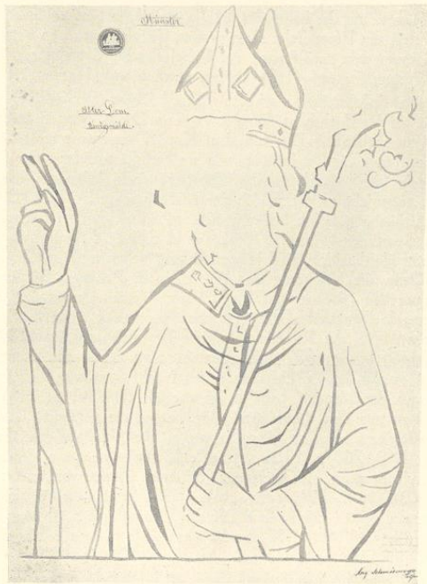
Abb. 2022. Der hl. Switger Wandgemälde im ehemaligen Alten Dom

der Nordhälfte der Westfront, zwischen 1570 und 1610 erbaut, wurde 1748 abgebrochen (vgl. S. 317 und 319). Auf dem Plane Schlauns ist das nördliche Mittelfenster des Langhauses als blind wiedergegeben. Das untere Mauerwerk gehört der Mitte des 13. Jahrhunderts, alles andere den Jahren unmittelbar nach der Wiedertäuferzeit an. Nach der gemalten Ansicht des Domhofes waren die Kirchenwände sehr hoch. Die Maße sind nicht überliefert. Das schlanke Glockentürmchen der Westfront, das Kerssenbroch als illustris bezeichnet, erscheint auf dem Stadtbilde von 1570 rund, auf den späteren sechseckig mit einem oberen Umgang ähnlich dem des Ludgeriturmes.