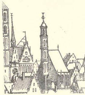
Abb. 2018. Ansicht von Westen von Hermann tom Ring, 1570