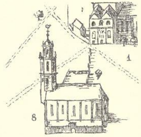
Abb. 2020. Ansicht von Süden von E. Alerding, 1636