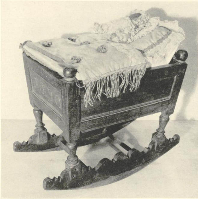
Abb. 2142. Die Johannes-Wiege von 1630 früher im Armenhause S. Elisabeth zur Aa