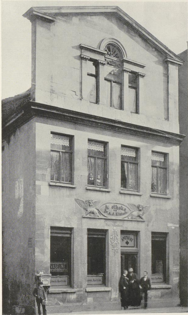
Aufnahme der Sammlung Hotte um 1900