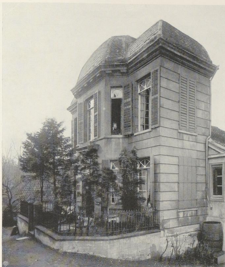
Aufnahme der Sammlung Hütte um 1900