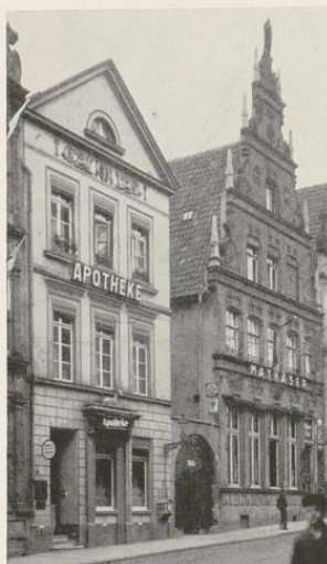
Abb. 1309. Das Haus Roggenmarkt 13 (links) von Westen

Mangels alter Zierformen kaum datierbar, aber auf dem Plane von 1839 schon verzeichnet. Merkmale Schlaunscher Architektur, von denen E. Müller, Altmünsterische Gartenhäuser , M. A. 8. IV. 1925, spricht, sind nicht vorhanden. Vermutlich aus dem Anfange des 19. Jahrhunderts.