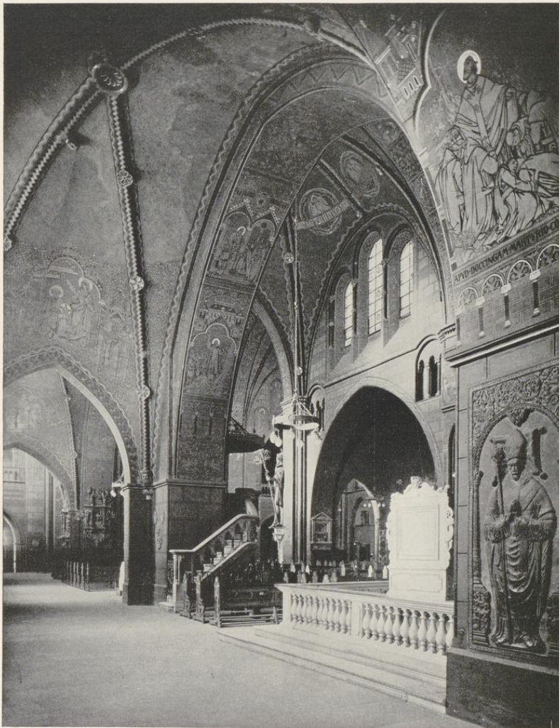
Abb. 1382. Blick in das südliche Seitenschiff von Südosten