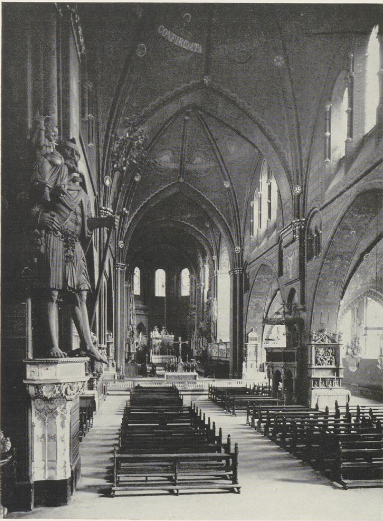
Abb. 1381. Blick in das Mittelschiff nach Osten