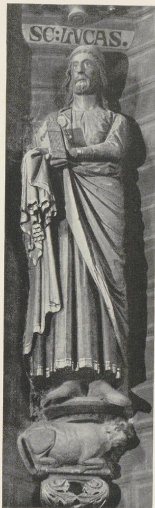
Aufnahme 1931 Abb. 1399. St. Lukas am Südwestpfeiler der Vierung Vgl. S. 88, 4

Das bestätigt die stilistische Untersuchung bei Thomas S. 39 f. Auffallend ist die abweichende Gestaltung ihrer Baldachine, die bei den beiden Aposteln zur Rechten trommelförmig mit reichen Verzierungen gestaltet