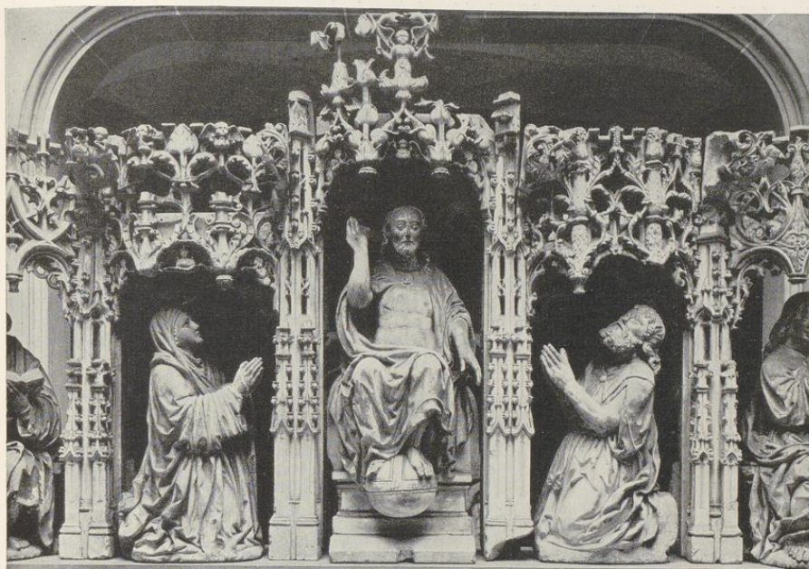
Abb. 1411. Die drei mittleren Figuren des Apostelganges im Landesmuseum Vgl. S. 110