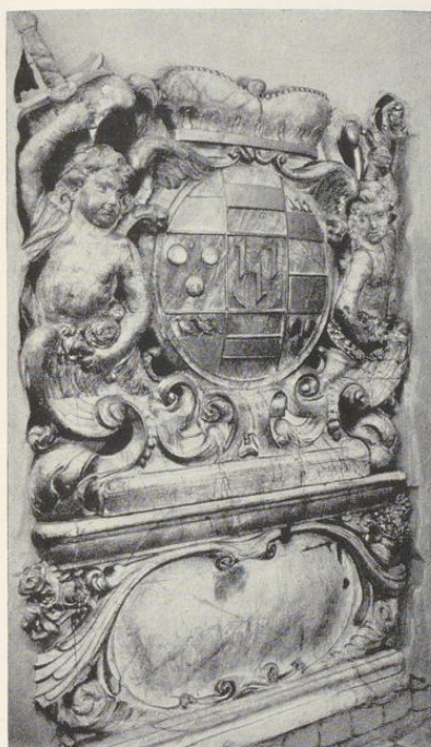
Abb. 1471. Das v. Galensche Wappen Vgl. S. 164