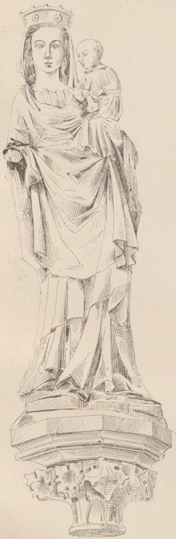
Madonna u. d. Tiefendunge zu Soest.