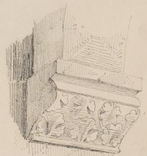
Geisse: St. Thomas.