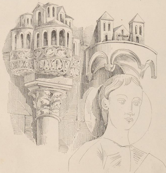
Ueballe d. Doms zu Münster.