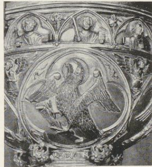
Abb. 1598. Der Johannes-Adler

Die Vierpässe des Taufbeckens; vgl. S. 366 Aufnahmen 1937