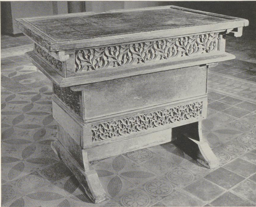
Abb. 1485. Der Zahlisch des Domkapitels Vgl. S. 192