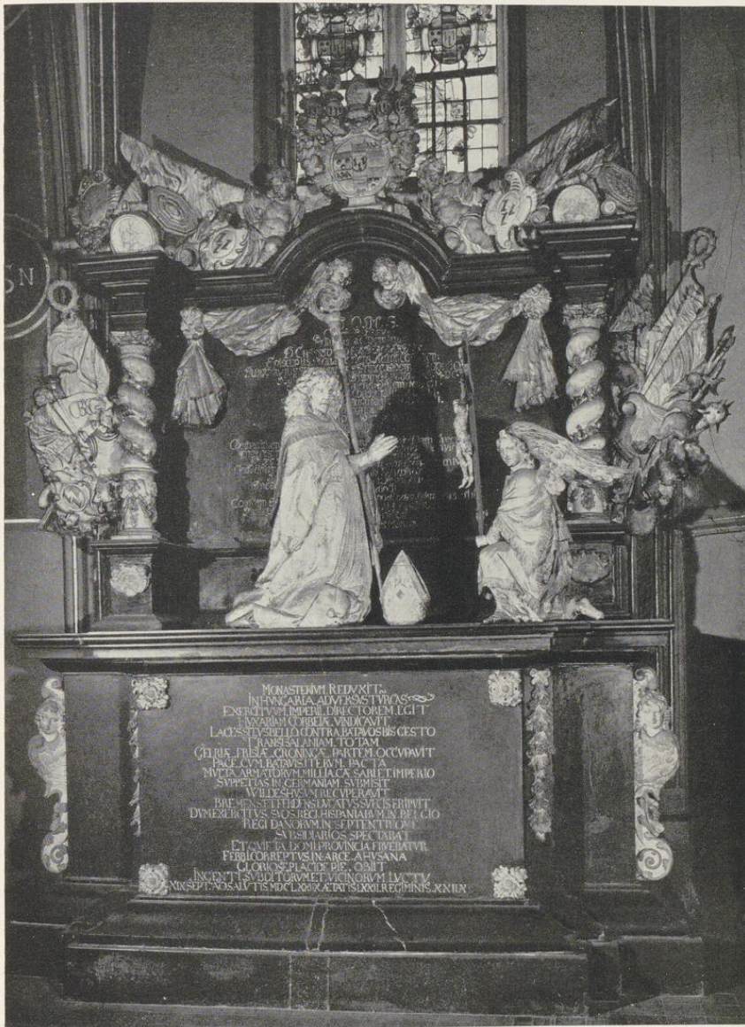
Abb. 1510. Das Grabmal Bischof Christoph Bernhards v. Galen, † 1678 Vgl. S. 251