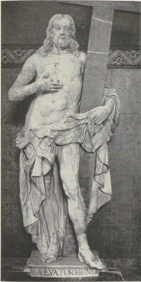
Abb. 1546. Figur des Welterlösers, 1723 von Franz Matthias Hiernle? Vgl. S. 294