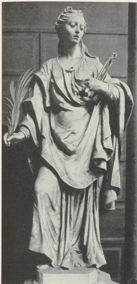
Abb. 1544. Figur der hl. Apollonia von Johann Wilhelm Gröninger Vgl. S. 292