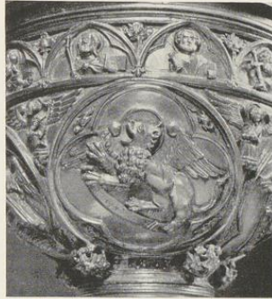
Abb. 1595. Der Markus-Löwe