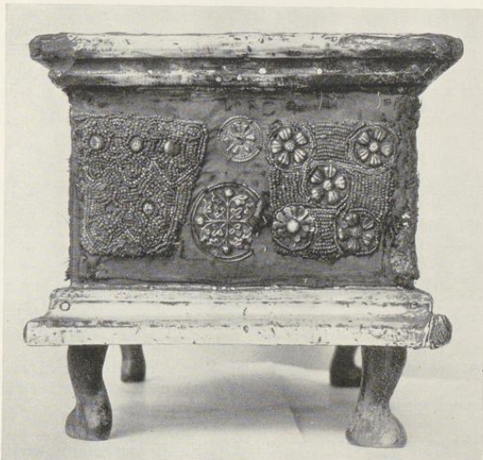
Abb. 1600. Der Tragaltar, Schmalseite; vgl. S. 370