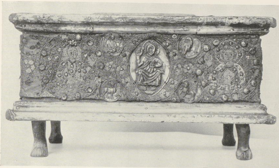
Abb. 1599. Der Tragaltar, Langseite; vgl. S. 370