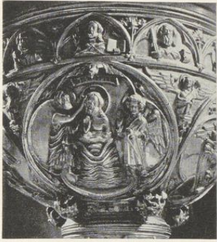
Abb. 1594. Die Taufe Christi