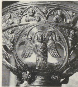
Abb. 1597. Der Matthäus-Engel