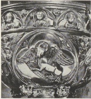
Abb. 1596. Der Lukas-Stier