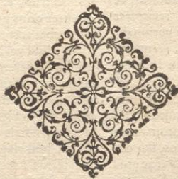
Abb. in cit. §. In aliis; num. 28.

XXIX. Ex dictis inferitur resolutio illius questionis, an, si colonus laicus conventus nomine Clericum in Judicio tanquam Dominum, seu locatorem, Clericus respondere, & se defendere debeat coram Judice seculari? Ad quod responderetur, si colonus laicus conventus rei vindicatione, ratione prædij sibi locati à Clerico; usque id denunciaret Clerico locatori; tum, quia Clericus venit in Judicium tanquam nominatus, & Dominus, adeoque principalis reus, debet coram suo Judice Ecclesiastico conveniri, novo libello contra illum oblato; neque censetur adhuc esse ceptum Judicium cum colono laico, qui per nominationem Domini declinavit subire Judicium coram suo Judice seculari. Vel Clericus vendidit prædium laico; quod postea tertius interveniens ait, ad se spectare tanquam Dominum: tum debet actio, sive rei vindicatio contra laicum emptorem institui coram suo Judice seculari, coram quo etiam Clericus ipsi assistere debet, eumque defendere, ne res ab eo evincatur: quia ipse Clericus tunc non est reus principalis, cum actio principaliter instituat contra laicum emptorem, qui rem proprio nomine tanquam suam possidet.