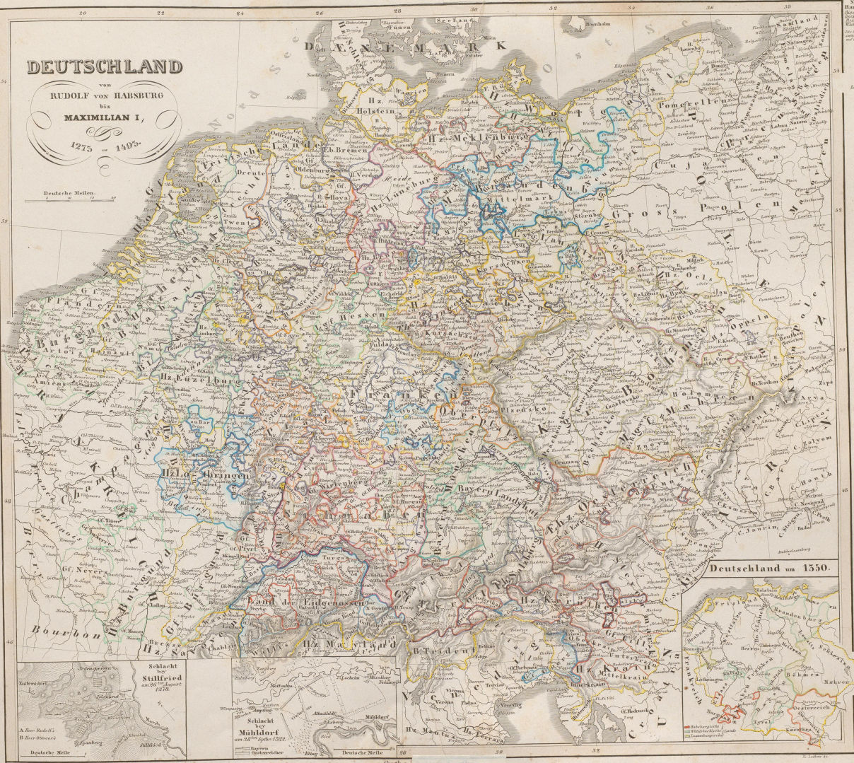
Deutschland um 1550.